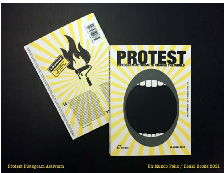
Un mundo feliz (Sonia Díaz, Gabriel Martínez): Protest , 2021. Region of Madrid. Hoaki Books