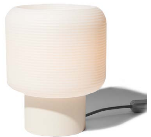
Muka Design Lab. Lucas Abajo, Laxmi Nazabal: Maskor , 2019. Basque Country. Gantri Inc