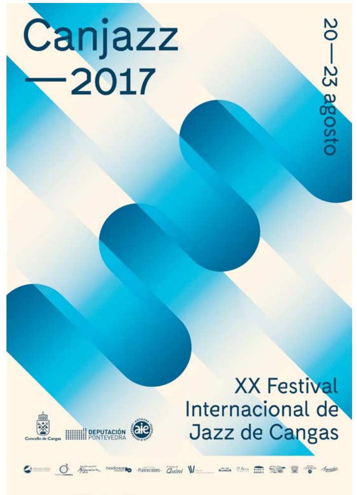
Guillotina Studio: Canjazz , 2017. Galicia. Concello de Cangas

que convierten el espacio 3D circundante en sonidos intuitivos, firmadas por Alegre Design y pensadas para ofrecer la mejor experiencia de usuario.