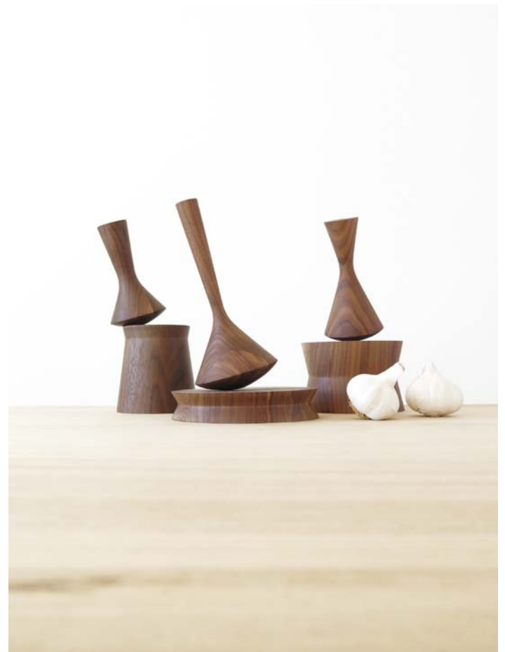
Martín Azúa: TOTEM , 2019. Catalonia. Mobles 114

Complicities. We could say that this theme transverses the whole exhibition because the current moment forces us to paint the world taking into account people's wellbeing whilst facing challenges